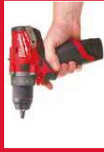
Mais potência, mais compacto