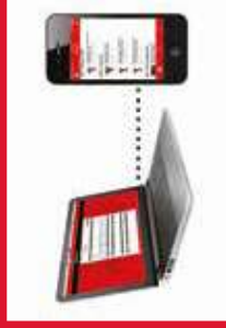
Aplicação de gestão de inventário