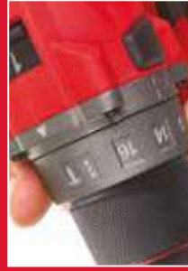
Embalagem eletrônica com 13 posições de torque, 1 para furação e 1 para furação com percussão