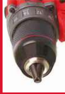
Bucha metálica, aperto rápido 13mm