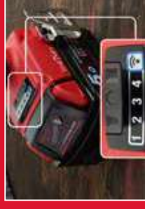
Quando perfis específicos para aplicações repetitivas