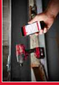
Total personalização do ferramenta graças à aplicação ONE-KEY™